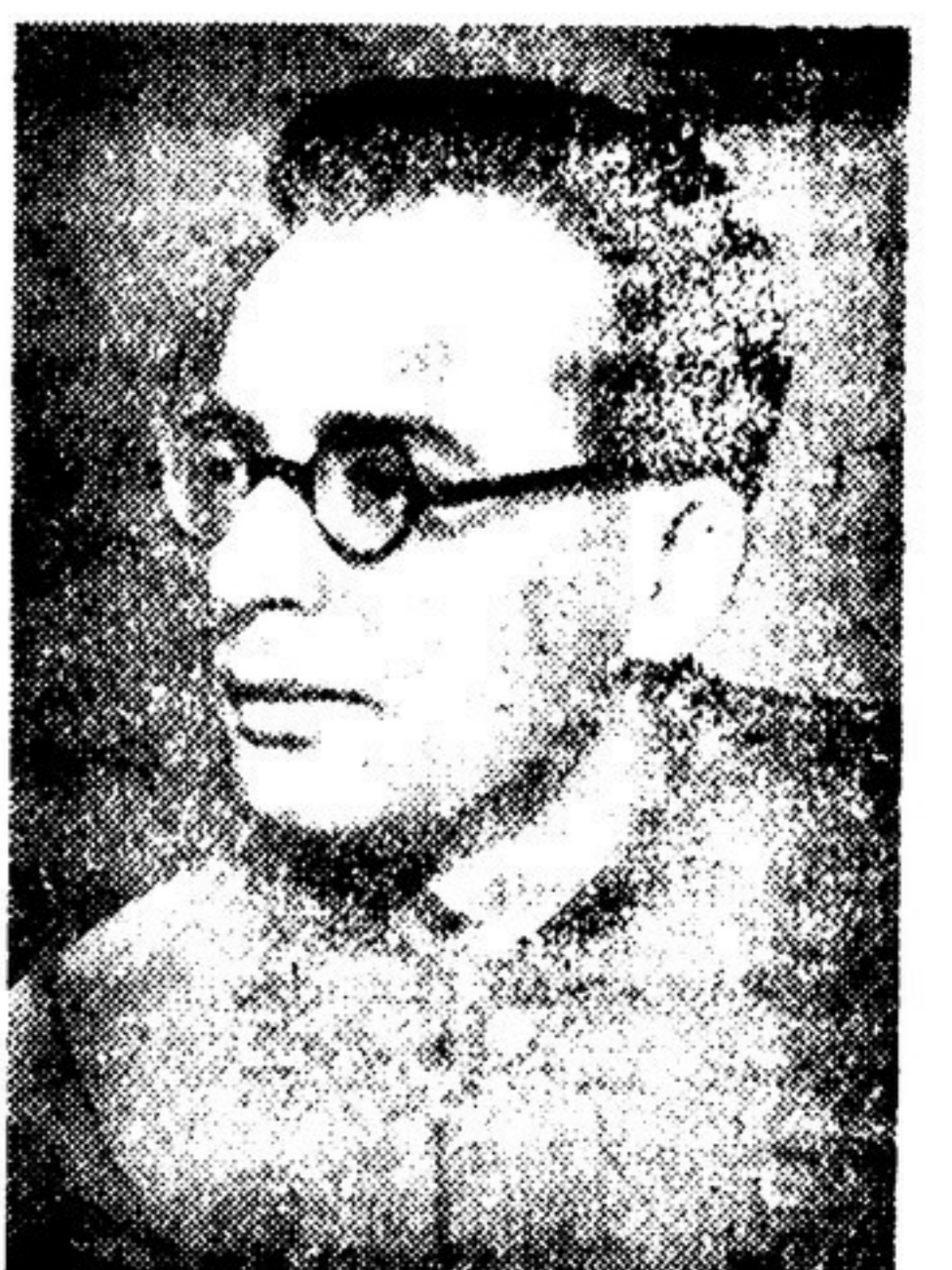
Э. Г. КАЗАКЕВИЧ