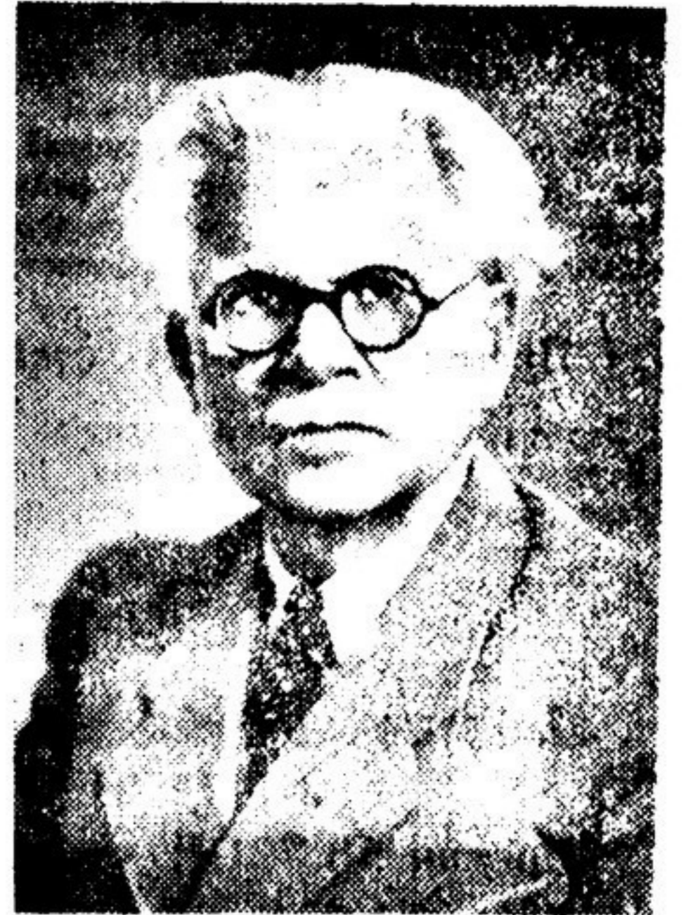
Ф. В. ГЛАДКОВ