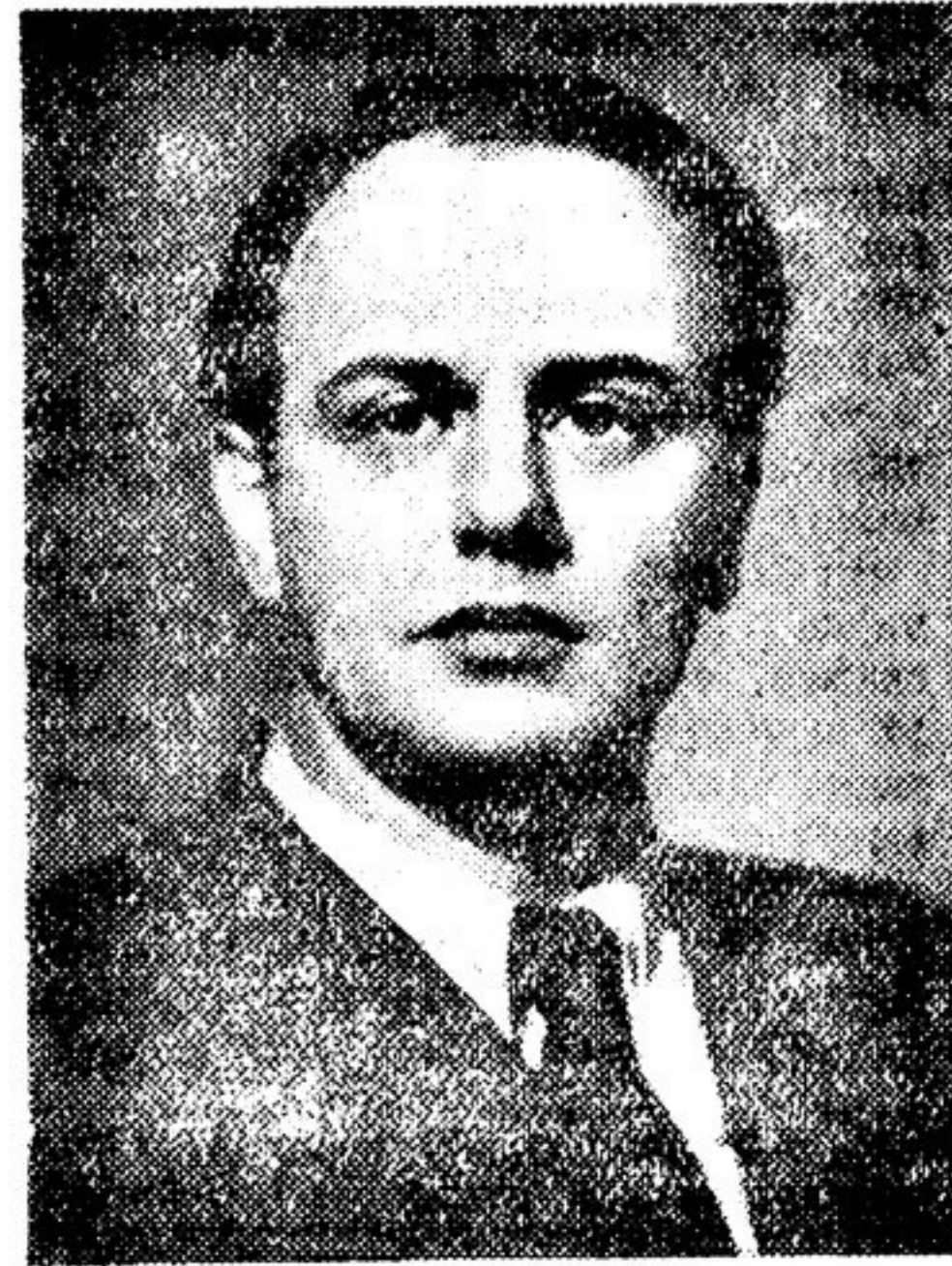
Е. А. ДОЛМАТОВСКИЙ