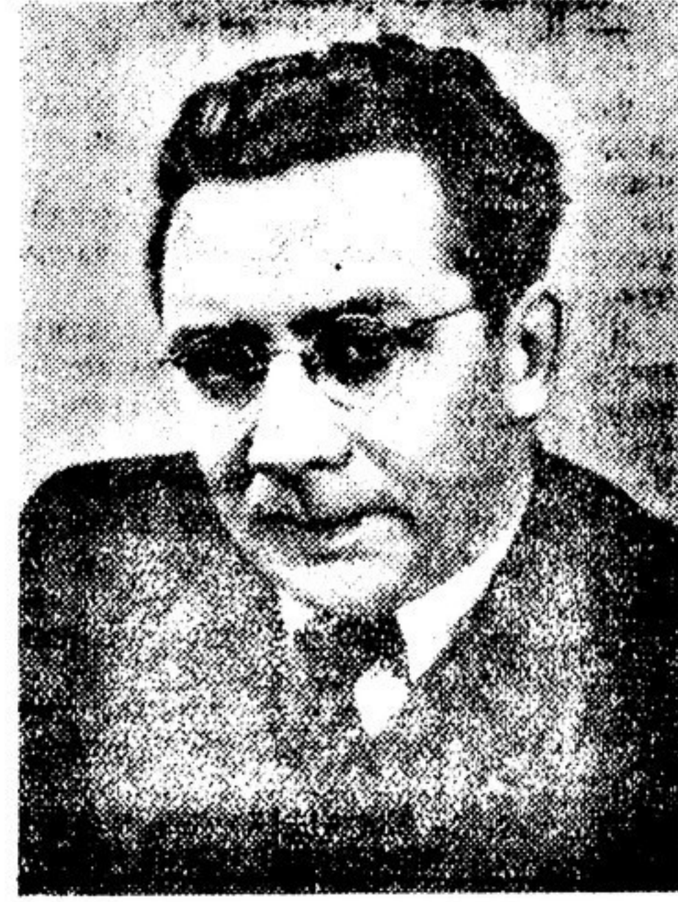
В. В. ЕРМИЛОВ