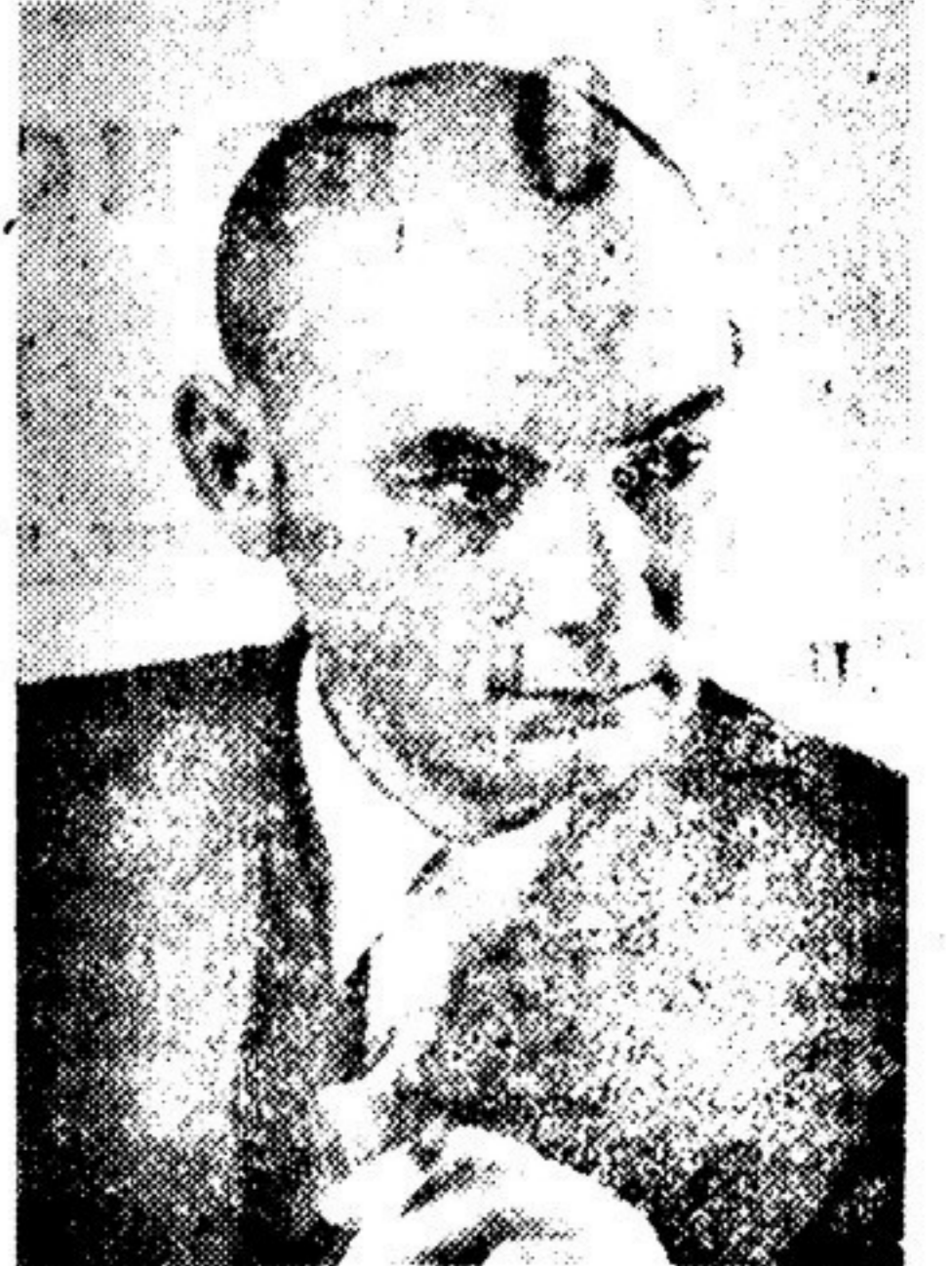
С. П. БАБАЕВСКИЙ